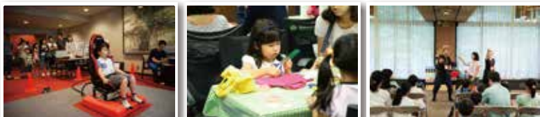
第1回防災推進国民大会より